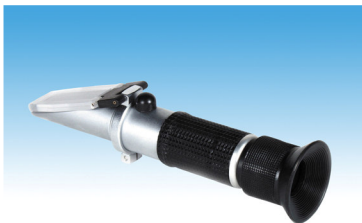
Niet bindende foto.