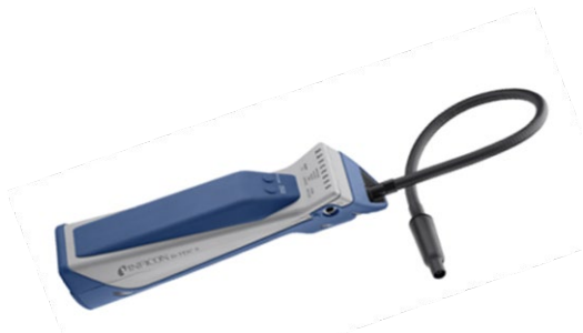
Niet contractuele foto